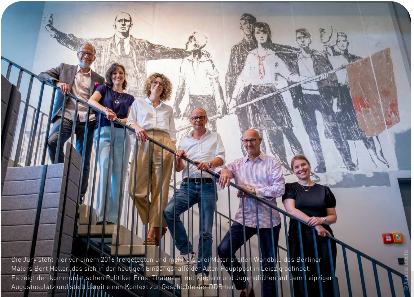
Die Jury steht hier vor einem 2016 freigelegten und mehr als drei Meter großen Wandbild des Berliner Malers Bert Heller, das sich in der heutigen Eingangshalle der Alten Hauptpost in Leipzig befindet. Es zeigt den kommunistischen Politiker Ernst Thälmann mit Kindern und Jugendlichen auf dem Leipziger Augustusplatz und stellt damit einen Kontext zur Geschichte der DDR her.